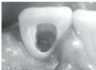
Obr. 1 - otevřete přístup do dřeňové dutiny z lingvální strany. Odstraňte všechny výplňový materiál a gutaperču 2-3 mm apikálně k CEJ.