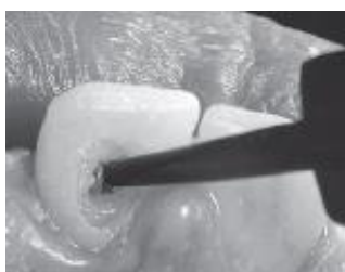
Obr. 2 – vytlačte Opalescence Endo do dřeňové dutiny, zabraňte kontaktu s měkkými tkáněmi. Do gelu vložte maličký smotek vaty. Ponechte dostatečný prostor na provizorní výplň.