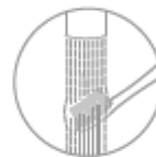
Čištění hlav kartáčku

Po každém použití umyjte hlavu a kartáček a nechte jej oschnout. Netlačte za kartáček, jinak se zdeformuje a upadne.