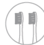
Výměna hlavy kartáčku

Povrch rukojeti omyjte čistou vodou, otřete jej měkkým hadříkem a nechte oschnout. Netlačte na pryžové těsnění na kovové ose ostrými předměty, aby nedošlo k jeho poškození.